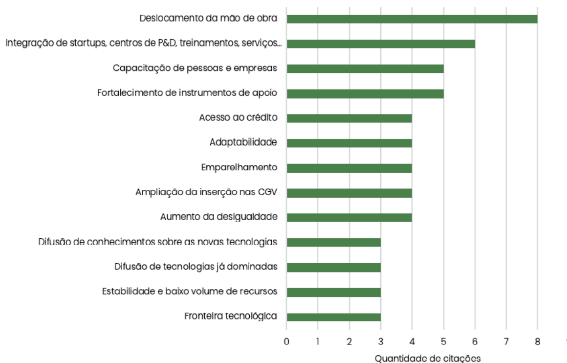
Gráfico 2. Principais desafios relativos às novas tecnologias na literatura atual